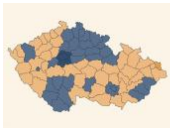
Vítězství pravice a levice v okresech