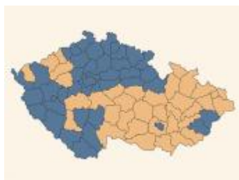
Vítězové v okresech

Tato závěrečná čísla ukazují, že letošní volby nepřinesly jasný posun doleva na Moravě a opačný posun v Čechách. Naopak volby 2006 zakonzervovaly geografické pozice obou velkých stran, jak existovaly již v minulých volbách.